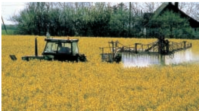
Trattore che sparge pesticidi

Oggi in campagna si usano molti veleni ( pesticidi ): contro gli insetti che mangiano i cereali o la frutta; contro i funghi che distruggono i raccolti; contro le erbe cattive (infestanti) che non lasciano crescere le piante coltivate. I veleni però fanno male anche all'uomo. In alcuni Paesi si cerca allora di usare alcuni insetti utili contro gli insetti dannosi . Per esempio, si usa un tipo di vespa (insetto utile) per uccidere la mosca bianca, che mangia le foglie delle piante coltivate (insetto dannoso). In questo modo, si possono usare meno pesticidi e anche il cibo che l'uomo mangia è meno «avvelenato».