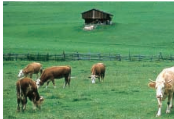
Mucche al pascolo in Tirolo

I prati dove l'uomo porta gli animali a pascolare (mangiare l'erba) si chiamano pascoli .