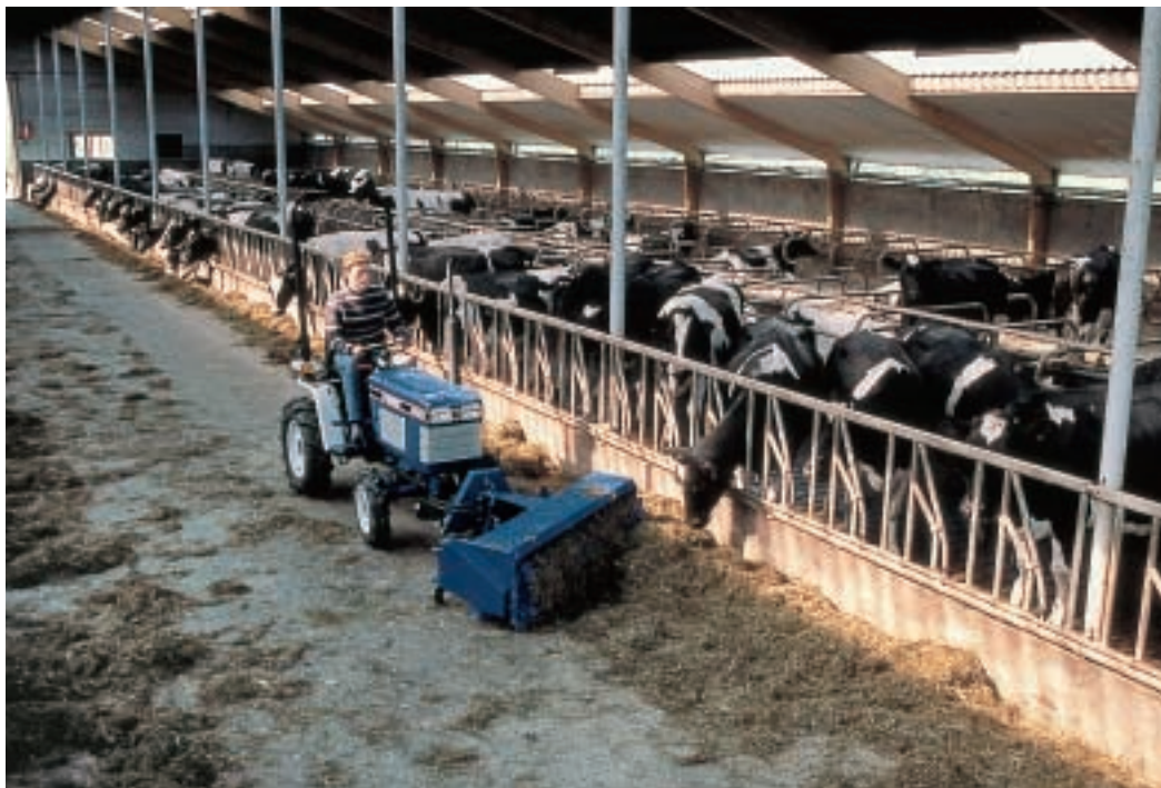
Stalla per mucche da latte

Le stalle sono delle costruzioni dove si allevano soprattutto gli animali più grandi (le mucche e i vitelli). Qualche volta anche le pecore e le capre.