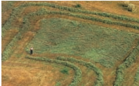
Prato con l'erba tagliata

I prati dove l'uomo porta gli animali a pascolare (mangiare l'erba) si chiamano pascoli .