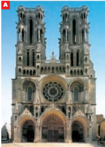
Cattedrale di Reims

Le città che erano importanti nel Medioevo (fra il Mille e il Millequattrocento), nel centro hanno ancora qualche parte delle mura medievali. Hanno le strade strette e alcuni monumenti di quell'epoca, come la chiesa più importante (la cattedrale ) e il Palazzo del Comune , come vedi qui sotto: