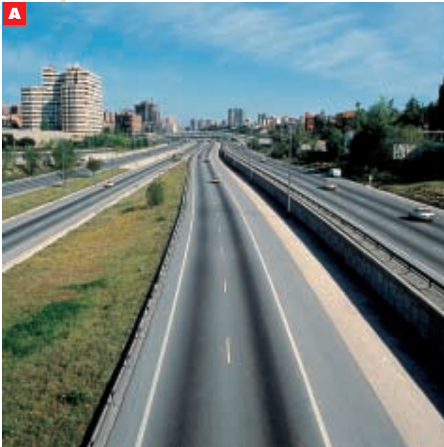
A Anello autostradale che circonda Madrid

Infine, si costruiscono nuove strade, la metropolitana (una ferrovia sotterranea che collega i vari quartieri) e grandi strade con molte corsie ( assi di scorrimento , o tangenziali , o anelli autostradali ) che girano intorno alla città e portano ai vari quartieri più esterni, alle zone industriali o ai grandi supermercati.