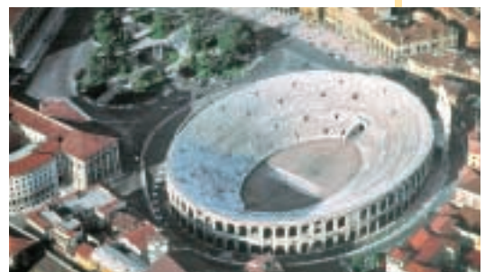
Anfiteatro romano di Verona

Le città che erano già importanti in epoca romana (come Roma, Verona o Torino) nel centro storico hanno ancora qualche monumento romano .