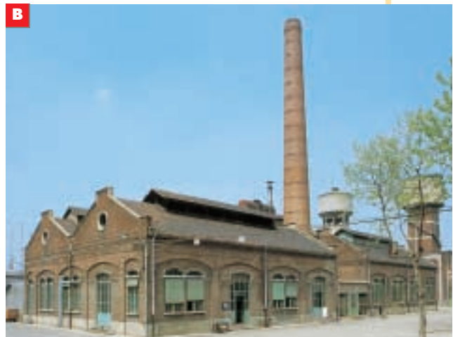
Fabbrica di fine Ottocento in Lombardia

Molti edifici della città industriale sono ancora oggi molto importanti: la stazione ferroviaria , il grande ospedale , i giardini pubblici , lo stadio . Le fabbriche di quei tempi, invece, di solito non funzionano più. Al posto delle vecchie fabbriche ci sono nuove industrie ( impianti più moderni ) abbastanza lontane dal centro della città.