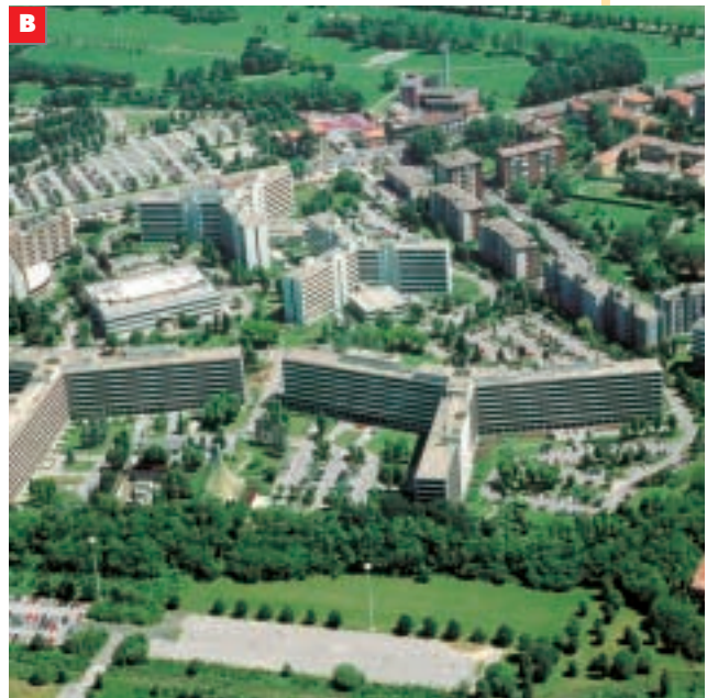
B Palazzi in periferia a Milano