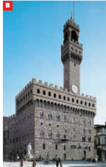
Palazzo Vecchio a Firenze