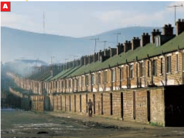
Case a schiera in un quartiere operaio di Belfast (Irlanda)

Intorno al centro storico c'è la città industriale , che è stata costruita quando le industrie sono diventate molto importanti e tanta gente è andata a lavorare nelle fabbriche. In Europa, questo è successo fra il 1850 e l'inizio del Novecento. Nella città industriale ci sono: i quartieri borghesi più vicini al centro, con case belle e strade piuttosto grandi (i viali); le fabbriche e i quartieri operai più in periferia, con case più povere, spesso tutte uguali o molto simili, come vedi qui sotto: