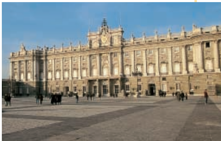
Palazzo Reale a Madrid

È la capitale dal 1561 ; prima era una piccola città circondata da campi dove si allevavano le pecore. Il re Filippo II scelse Madrid come capitale perché era al centro del Paese. Da quel momento la città è diventata sempre più grande e importante; sono state costruite le strade e i palazzi più belli, come il Palazzo Reale , l' Accademia reale delle Belle Arti e il museo del Prado .