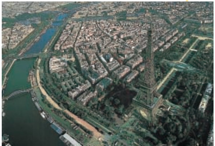
La Senna e la Torre Eiffel a Parigi

A Parigi ci sono negozi, università famose, ministeri, teatri e musei. È una città che attira ogni anno milioni di turisti. Ha anche una grande periferia, dove vivono più di 7 milioni di persone. In questa fotografia puoi vedere la Torre Eiffel, il simbolo di Parigi. È stata costruita nel 1889. È tutta in acciaio ed è alta più di 300 metri. In cima alla torre c'è un ristorante. Il fiume che vedi è la Senna.