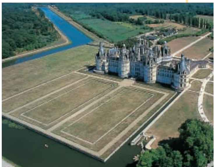
Castello di Chambord lungo la Loira

La Champagne è famosa per i suoi vini, mentre la Normandia è famosa per l'allevamento dei bovini e per i suoi formaggi. Nella Valle della Loira il paesaggio è bellissimo e questa regione viene chiamata «il giardino di Francia». Per questo in passato molti nobili e re francesi hanno fatto costruire qui i loro castelli, che oggi attirano molti turisti.