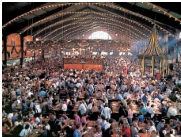
L'Oktoberfest a Monaco

Monaco, nella zona meridionale, è una città industriale e commerciale, con importanti musei e università. È famosa per l'Oktoberfest, una grande festa della birra all'inizio di ottobre.