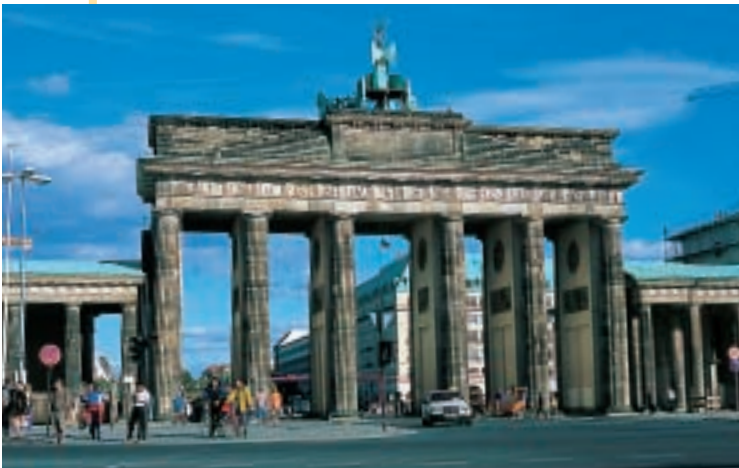
La porta di Brandeburgo a Berlino

La Germania ha molte città importanti. Le più grandi sono: Berlino, Amburgo, Monaco, Colonia e Francoforte. Berlino è la capitale; ha molte industrie, negozi e centri commerciali, musei, università e parchi.