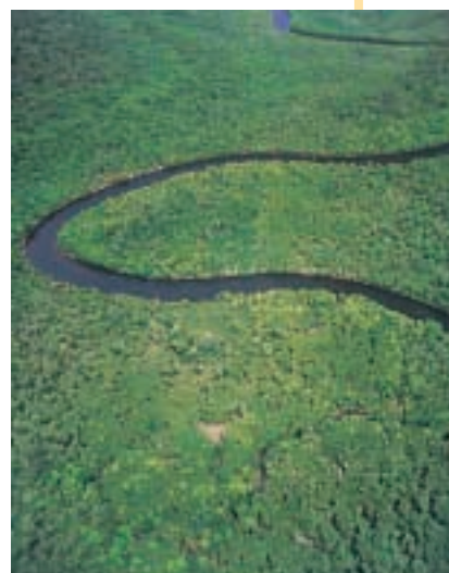
Foresta pluviale del Borneo (Indonesia)