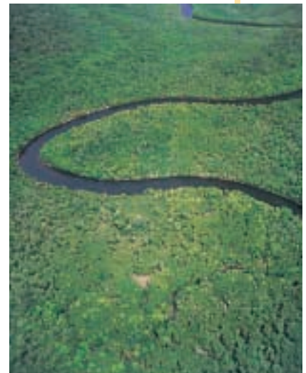
Foresta pluviale del Borneo (Indonesia)