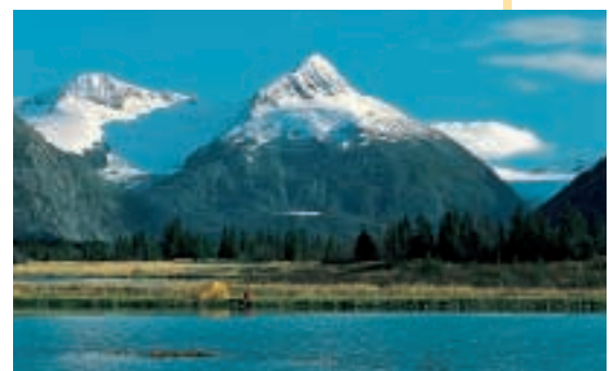
Montagne dell'Alaska (Nordamerica)

In queste zone in inverno la neve ricopre tutto, ma in estate puoi vedere boschi di conifere, la roccia nuda e i ghiacciai.