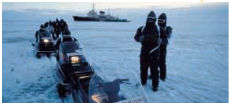
Golfo di Finlandia ghiacciato

Il Golfo di Botnia e il Golfo di Finlandia sono mari circondati dalla terra. Non sono molto profondi e durante l'inverno sono gelati da 3 a 5 mesi. Quando il mare è ghiacciato si usano le navi rompighiaccio. Sotto la superficie gelata del mare i pesci continuano a vivere. Questi mari sono ricchi di pesce.