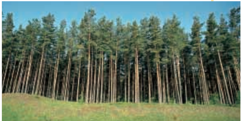
Foresta di conifere

Quasi tutto il territorio della Svezia e della Finlandia è ricoperto di boschi di abeti, pini e larici (conifere). Gli Svedesi e di Finlandesi sanno che gli alberi sono una ricchezza. Tagliandoli si ottengono legno e carta. Per non perdere questa ricchezza, dopo aver tagliato gli alberi, i Finlandesi e gli Svedesi ripiantano nuovi alberelli.