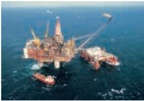
L'estrazione del petrolio

Il Mar del Nord è attraversato da molte navi da pesca e da trasporto; sulle coste che circondano questo mare ci sono sei grandi porti . I più importanti sono il porto di Londra (nel Regno Unito) e quello di Rotterdam (nei Paesi Bassi).