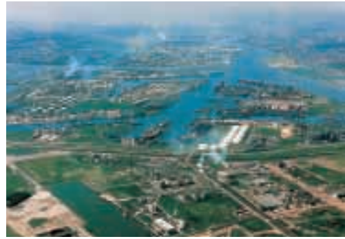
Porto di Rotterdam