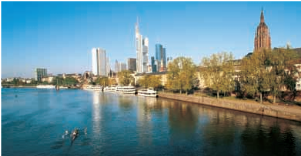
Francoforte con i suoi grattacieli

Sono importanti anche le città di Praga , che è la capitale della Repubblica Ceca, e Monaco , che si trova in Germania.