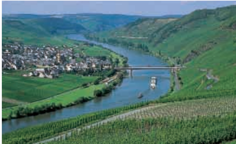
Massiccio Renano attraversato dal fiume Mosella

Tra le basse montagne antiche ci sono delle zone molto fertili che vengono coltivate; si coltivano orzo, frumento e barbabietole da zucchero . In queste pianure si allevano anche gli animali, soprattutto i bovini e i suini (i maiali). Lungo il fiume Reno si coltiva la vite .